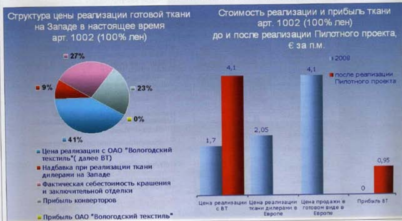
Рис. 1. Структура цены и стоимость реализации готовой ткани до и после реализации проекта

Необходимо признать, что в нашей стране оборудование предприятий всех звеньев производственной цепочки морально и физически устарело. Оно не в состоянии производить высококачественную продукцию, востребованную современным рынком.