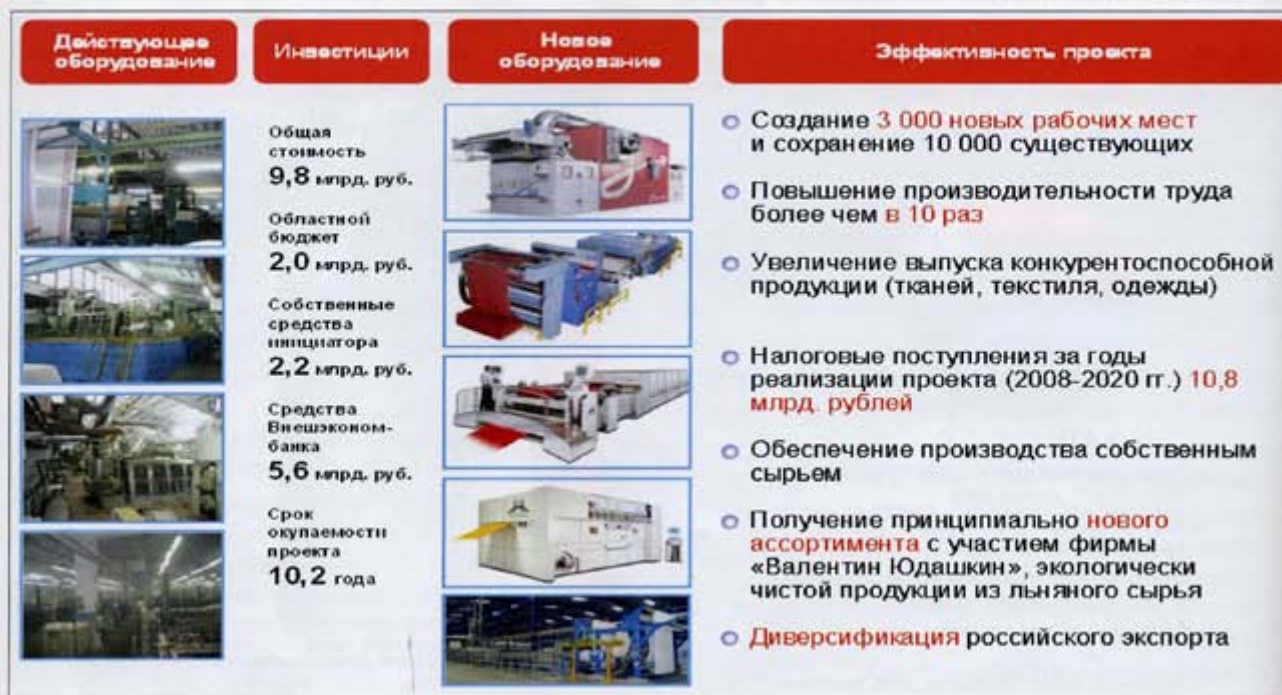
Рис. 3. Развитие льняного комплекса Вологодской области

– выделение из областного бюджета субсидий текстильным и льноперерабатывающим предприятиям на возмещение процентных ставок по привлеченным